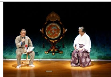
中津市雲八幡宮 雅楽会

開催日時：毎月第3木曜日 10:00~12:00 (6月のみ第2木曜日) 受講料：3,000円(全10回分) ※初回に収めていただきます 対象：60歳以上の方ならどなたでも。