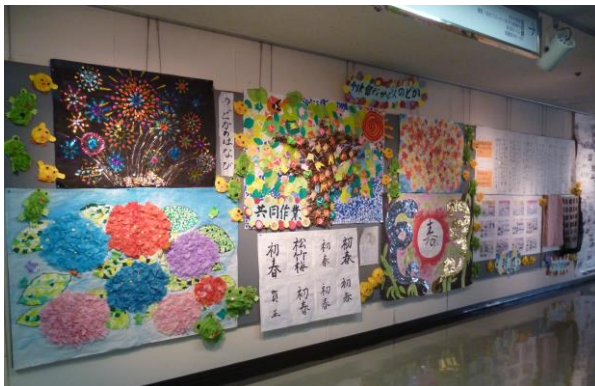
三階マルチスポット