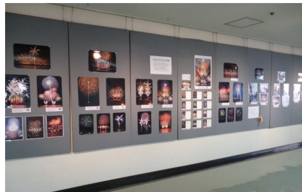
四階子どもギャラリー